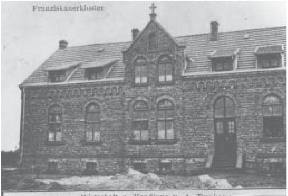
Weitestgehend fertiggestellt: Das Kloster im Winter 1908/09