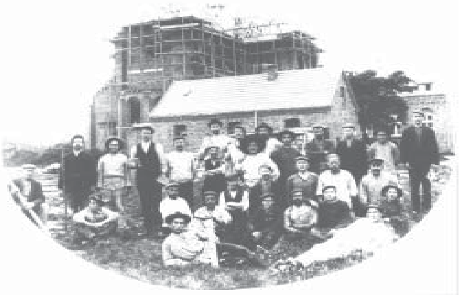
Die Klosterkirche im Entstehen Grundsteinlegung am 19. März 1909 ---- Benediktion am 21. Dezember 1909